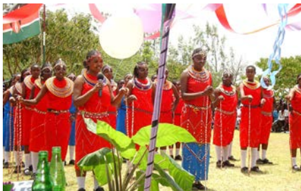
Bilder vom Schulabschlussfest 2014